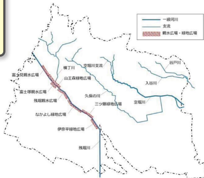
図5-6 河川・残堀川親水緑地広場の位置図