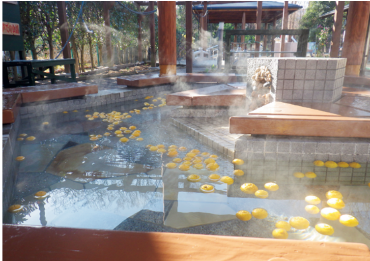
小平・村山・大和衛生組合「こもれびの足湯」