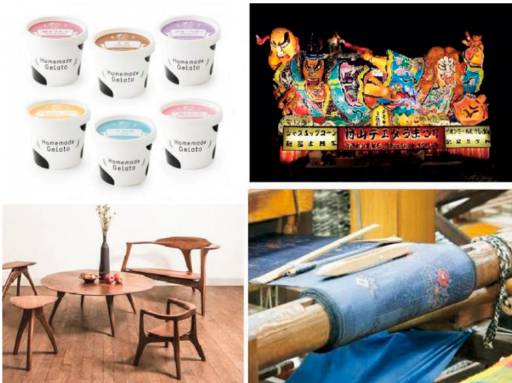
ふるさと納税返礼品及び応援メニューの一例