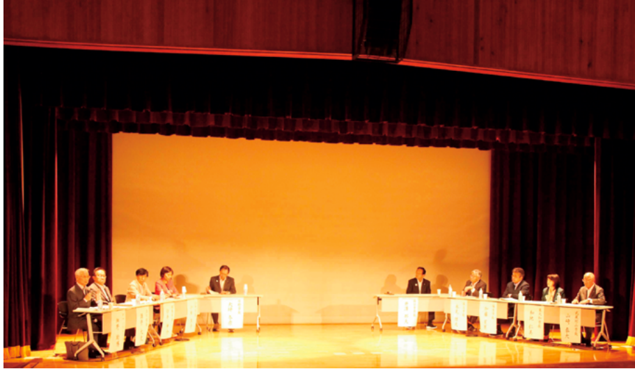
広域連携サミット