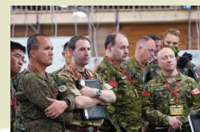
【同志国による研修】