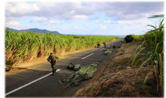
空挺降下後の地上戦闘