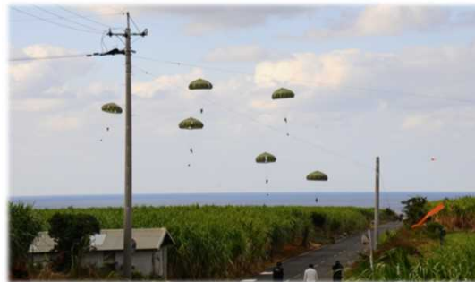
共同による空挺降下