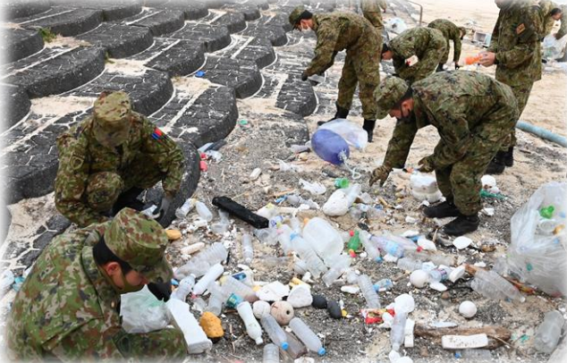
地域貢献活動（海岸清掃）