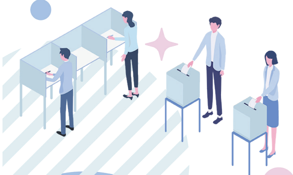
令和6年7月7日執行東京都知事選挙 年代別投票率