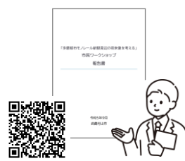
報告書はこちらから