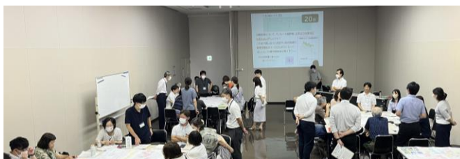
市民ワークショップの様子