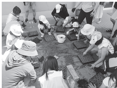
専門家の指導を受けたポット苗づくり

本校では、学校運営協議会のメンバーをはじめとした、地域の方々の協力をいただき、グリーンサポーター（校庭芝生推進協議会）の活動を行っています。