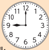
こうさくきょうしつうちあわ 工作教室打合せ