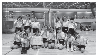
一小最強ガールズ