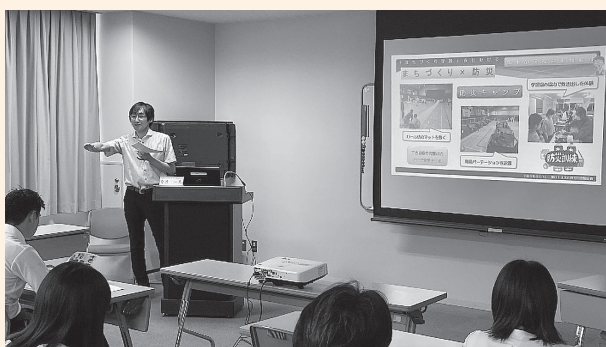
まちづくり学習の取組事例の発表を通じて、本市の教育施策の理解促進と教育管理職としてのマネジメント力の育成を図りました。【輝け!未来の教育管理職研修より】

将来の管理職を目指す教員向けには、校長先生などを講師として、「輝け!未来の教育管理職研修」を実施しました。学校の危機管理や学校づくり等について、講義を通して理解を深めました。研修で学んだことを、新学期からの指導に生かしていきます。