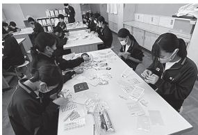
アクリルボックス製作

講師を快く引き受けてくださった地域の皆様、お手伝いいただいたPTA役員の皆様、学校運営協議会の皆様、ありがとうございます。引き続きご支援・ご協力をお願いいたします。