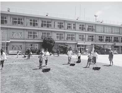
毎月の芝生メンテナンス（芝刈り）

本校では、学校運営協議会のメンバーをはじめとした、地域の方々の協力をいただき、グリーンサポーター（校庭芝生推進協議会）の活動を行っています。