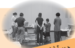
こうさくきょうしつ ようす 工作教室の様子だよ