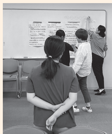
参加者が持ち寄った特別支援教室における指導の好実践事例を発表・共有・協議し、特別支援教室における指導の充実を図りました。【特別支援教室担任会より】