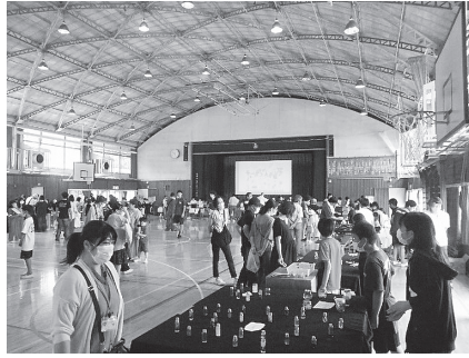
多くの人でにぎわうマーケットエリア

久々に地域の賑わいが校内に戻り、遊びや販売のお店を運営した子供たちもとても喜んでいました。このように人をおもてなしたり、起業したりする体験を、将来の武蔵村山市を担う「まちづくり学習」につなげていきます。