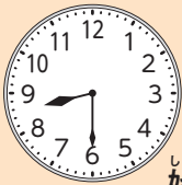
しぎょう こし 始業・古紙パトロール