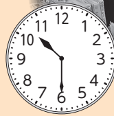
でんわたいおう しよるいさくせい 電話対応・書類作成