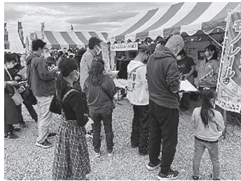
デエダラまつりに出店

新しくできるモノレール駅のまわりをにぎやかにするにはどうしたら良いか考えていますので、ぜひ、小・中学生の皆さんの考えを教えてください。