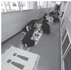
スローガンを制作しています

週に2回、活動をしています。個人制作を中心に、イラストを描いたり、工作をしたりしています。学期ごとに校内で作品展を行い、それぞれの力作を展示しています。運動会などの行事ではスローガン作成や、卒業式、入学式の装飾なども行っています。和やかに活動しています。