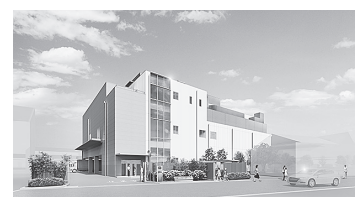
たてもの かんせいよていず 建物の完成予定図

私たち教育総務課教育施設担当は、主に学校関係の工事を担当しています。普段は、学校を直す工事がほとんどですが、なんと、昨年からの新しい建物を建てる工事が始まりました。皆さんも学校でお世話になっている、給食を作る施設です。今度も小学生の皆さんに美味しい給食を届けられるよう、工事内容の確認や立会い、打合わせをして、スケジュールどおり2年後に完成できるように監督することなどが、私たちの仕事です。施設が完成した際には、ぜひ見学に来てください。