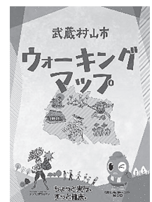
ウォーキングマップ

皆さんが、心も体も健康に過ごすためにはどのようなことが必要なのかを考えながら、健康教室や検診などを実施しています。中でも、ウォーキング教室は四季折々の植物を見ながら歩き、知らない道を発見できる魅力的な教室の1つです。参加対象は20歳以上の方ですが、実際に歩くコースが載っているウォーキングマップは図書館や地区会館などに置いてあるのでぜひ手に取って、休日などに歩いてみてください。