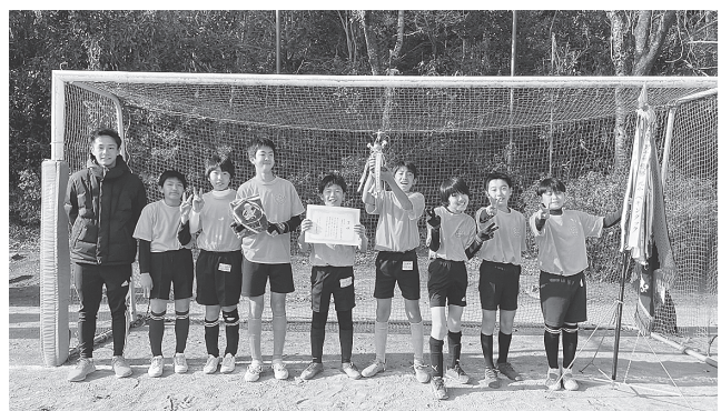
一小イナズマイレブン