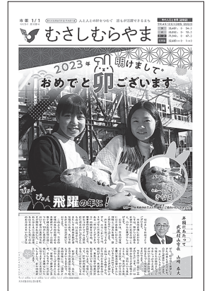
れいわ ねん がついちちごうしほう 令和5年1月1日号市報

秘書広報課は、秘書係と広報広聴係の2つに分かれています。秘書係は、市長、副市長の予定の調整を主にしています。広報広聴係は、皆さんのおうちに届く「市報」の作成、市内の写真などを撮影して、TwitterやFacebookなどを使用して、市の魅力を発信しています。また、市長宛に届く市民の皆さんからのご意見をとりまとめ、市長に報告をしています。