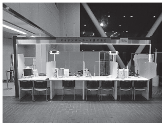
マイナンバーカード専用窓口

また、最近ではマイナンバーカードの申請サポートやできあがったマイナンバーカードを交付する手続きも行っていきます。