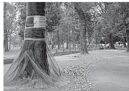
ナラ枯れ対策のため網を巻いた木

もしも公園で枯れそうな樹木や壊れそうな遊具を見つけたら、環境課に教えてください。