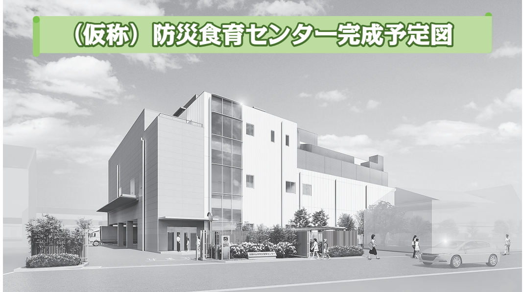
（仮称）防災食育センター完成予定図

老朽化した現在の学校給食センターに代わる施設として、「防災まちづくり構想」に基づき、災害時は応急給食拠点として稼働し、平常時は小学校給食の提供などを行う（仮称）防災食育センター」の整備事業を行っています。