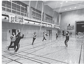
練習、頑張っています

活動目標を、「バスケットボールが好きになる」とし、部員7人で頑張っています。現在は、1年生の部員しかいませんが、バスケットボールの基礎を磨き、技術の向上に向け、日々の練習に協力し合いながら取り組んでいます。