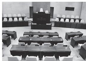
市議会が開かれる議場

市議会は4年に一度の選挙で市民の代表に選ばれた20人の市議会議員が、市役所の代表である市長や市の職員たちと定例会などで条例や予算などの重要な案件を話し合うことで、私たち市民の生活や社会がより良くなるために大切な役割を果たしています。