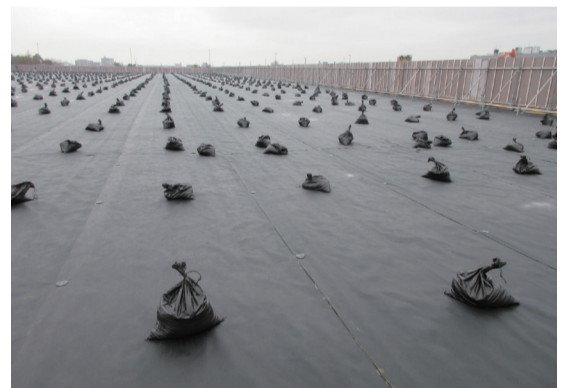
飛散防止のため周囲を囲い、防草シートで覆いました。