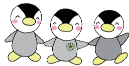
民生委員公式キャラクター「ミンジー」