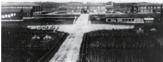
【東京陸軍航空学校 遠景】