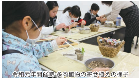
令和元年開催時 多肉植物の寄せ植えの様子