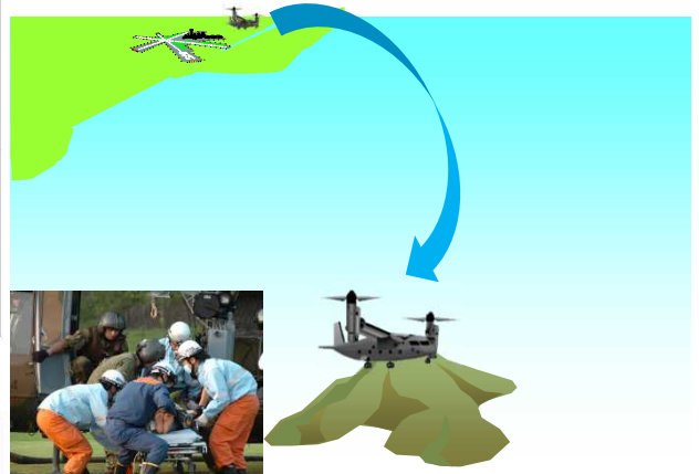
飛行場のない離島でも離着陸可能

1,000 km離れた離島に約2時間で到着 (輸送ヘリコプターの場合は約4時間)