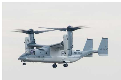
飛行開始(令和2年11月6日以降)