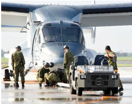
機体の到着、受入点検(令和2年7月上旬～)