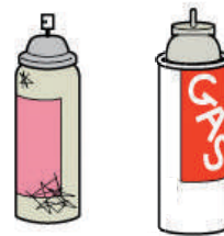
スプレー缶・カセットボンベ