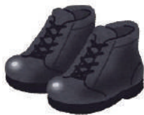
スパイク・安全靴