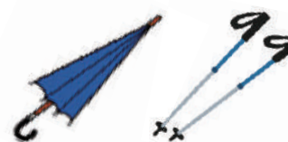
かさ・スキーのストックなど棒状のもの （1m未満のもの）【4本まで】