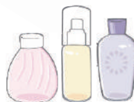
汚れが落ちないびん