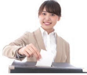
令和4年7月10日執行参議院議員選挙年代等別投票率

来年の春には、市議会議員選挙の執行が予定されています。若い世代の声を届けるためにも、普段から政治に興味を持ち、必ず投票に行きましょう。