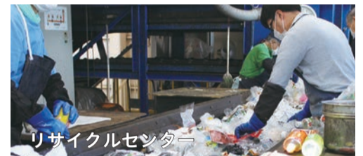
リサイクルセンター

整備期間中は、他の処理施設でご支援をいただき中間処理をすることになりますので、支援先の自治体および周辺住民に十分な配慮をし、適正な収集運搬やごみの分別を徹底していきます。