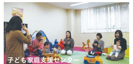
子ども家庭支援センター