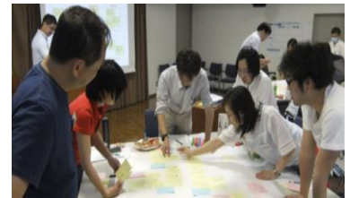
（ワークショップのイメージ）

一方的に講座を受けるのではなく、参加者が実際に参加・体験する講習会の手法です。参加者の皆さんによる各グループでの自由な発想や思いから討議を通して、将来の公園づくりについて考えていただきます。