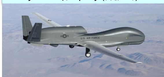
グローバル・ホーク(RQ-4)