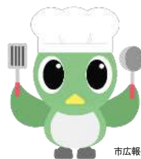
市広報キャラクター 「Mジロ」