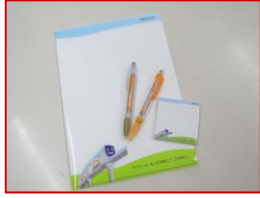
スピードくじで いずれかを！！