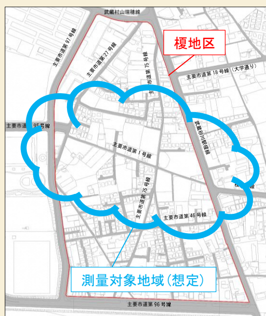
測量調査箇所案内図（想定）

「榎地区まちづくり」に関する情報は、市ホームページでもご覧になれます。 ホームページ検索番号：1010021