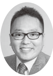
内野 直樹 (日本共産党)

仕様が変更になったと承知している。今後の対応については、東京都に伺ったところ、現時点では、物干し金物に関する基準設計の見直し予定はなく、以前の仕様に戻す考えはないとのことである。②今回の移転に伴い、分別されていないごみや収集の申し込みがされていない粗大ごみが収集できずに住宅の敷地内に堆積されている状況にあったことは認識している。このため、住宅の管理者である東京都と継続して協議を行い、事態の改善に向けた要請をした。東京都の対応としては、移転対象者に対し啓発を行うとともに、住民の協力を得ながら、堆積されたごみの分別を行い改善を図っており、すでに分別作業を終えた状況である。なお、分別が完了したごみについては、東京都の要請により、臨時の収集を行っており、今後も東京都と連携して対応していく。