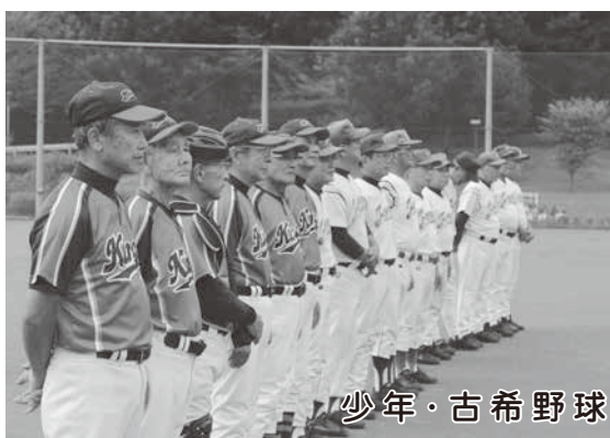
少年・古希野球チーム親善試合