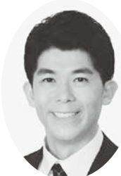
石黒 照久 (公明党)

答 選挙時においては、市報、ホー ムページ及び市防行政無線線による PRをはじめ、ごみ収集車によるPR 、市内公共施設への啓発ポスター 及び横断幕の掲出、市内循環バス車 内の中吊り広告の掲出、市内大型商 業施設での投票の呼びかけ、市内幼 稚園及び保育園の保護者に対する啓 発チラシの配布、新有権者への選挙 啓発がきの郵送、若年層を対象と した期日前投票立会人の公募等を実 施している。選挙時以外においては は、成人式やデグラまつり等のイ ベント時におけるアンケート調査及