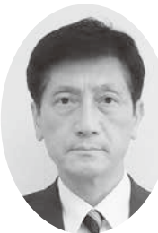
宮崎 正巳 (新国会)

立川都市計画道路3・4・39号線の南側一丁目付近は、計画幅員までは完成していない概成道路の位置付けの都道である。東京都及び区市町は、都市計画道路を計画的、効率的に整備するため、おおむね10年間で優先的に整備すべき優先整備路線を定めた事業化計画を策定し、事業の推進に努めている。当該区間については、平成28年3月策定の「東京における都市計画道路の整備方針（第四次事業化計画）」において優先整備路線に選定されていないため、拡幅整備の時期は未定となっている。