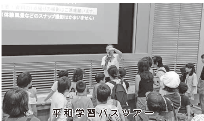
平和学習バスツアー

答 ①大韓国内で校内暴力等の予防に一定の効果が見られたFEELBOOTについて、日本の学校教育での有効性を測る実証実験ができないかとの打診が、平成29年9月頃、本市教育委員会にあり、電子機器環境や学校規模等を勘案した上で、小中一貫校村山学園において平成29年12月から実証実験を開始した。②日々、児童がタブレットに入力したデータについては、サーバーで管理し、校外には漏洩しない環境の中で管理をしている。③毎日2回、児童が朝と放課後にタブレットを活用して自分の気持ちを入力するため、一定の時間は要するが、児童や教員にとって負担であるとの報告はない。