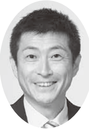
渡邊 一雄 (日本共産党)

樹木の管理方法等については、国土交通省が平成29年9月に策定した「都市公園の樹木の点検・診断に関する指針(案)」を参考に、職員が随時、日常点検を実施している。また、公園の管理等を委託している事業者、公園緑地等ボランティア及び公園利用者等からの情報提供もある。これらの情報を基に、樹木の高齢化等を起因とした事故を未然に防止するため、必要に応じて樹木の剪定及び伐採を実施している。