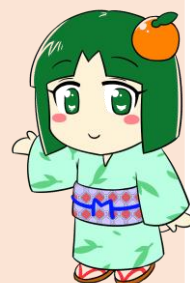
魅力づくり推進事業 PRキャラクター 「むむちゃん」