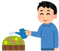
ガーデニング等の植木の水やり