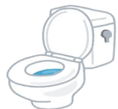
非常時のトイレの流し水等