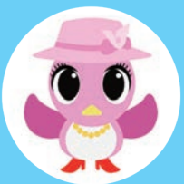
市広報キャラクター Mザベス