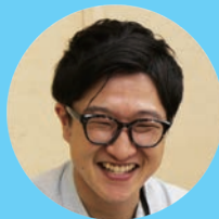
道路下水道課 高岡

私は事務職で採用されましたが、技術職の方も多い部署で、専門用語などを丁寧に教えてくださり和気あいあいとして、とても居心地が良いです。