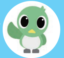
市広報キャラクター Mジロ

市役所一階で最も市民の方から見られることもあり、皆さん常に業務に真摯に、全力で、しかしそれでいてリラックスして取り組んでいらっしゃるように思います。 私はまだ今の環境に慣れておらず、常に肩に力が入りすぎてしまうので、早く先輩方のようになりたいです。