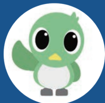
市広報キャラクター M ジロ