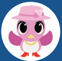
市広報キャラクター M ザベス