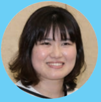
都市計画課 しまだ

現在は、新型コロナウイルスの影響で自粛しなければいけないので、休日や退庁後はお家で映画などを見てゆっくりしています。落ち着いたら休日は旅行に行きたいです。