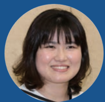
都市計画課 しまだ