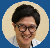
道路下水道課 高岡