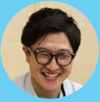
道路下水道課 高岡

一組織の一人として責任ある行動を意識しなければいけないと心がけるようになりました。