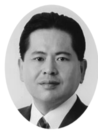
高橋 薫 (公明党)