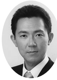
鈴木 明 (民主党)

多摩都市モノレール箱根ヶ崎方面への延伸については、平成12年の運輸政策審議会答申の目標年次が2年後となっていることから、引き続き東京都関係機関への積極的な要望活動を行い、延伸の早期実現に向け取り組んでいく。