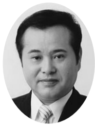
高橋 弘志 (公明党)