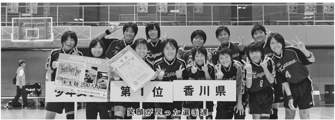
笑顔が戻った選手達

各学校においては、児童・生徒のアレルギー疾患に関する「学校生活管理指導表」や病歴を記載する「保険調査表」を作成するほか、学