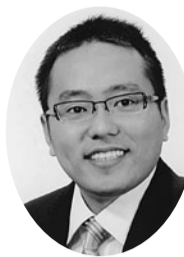
内野 直樹 (日本共産党)