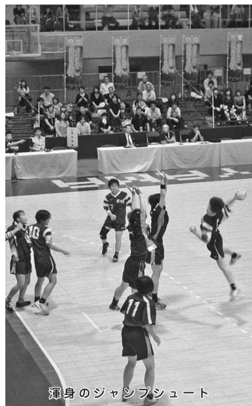
渾身のジャンプシュート

教員からの申請及び校長からの推薦に基づき、研修奨励審査会を経て受講を決定した教員は、小学校3人、中学校1人の合計4人となっており、他県で行われる「防災と地図活用講座」、「特別支援教育セミナー」、「造形教育研究発表校」への参加や視察、ハワイで行われる「教師語学文化研修」への参加となっている。教育委員会は、本研修を「輝き