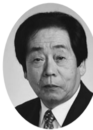
田代 芳久 (新国会)

掲載されている内容は、通告に対する当初の答弁であり、この後の再質問等の詳細については、会議録等をご覧ください。