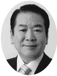
宮崎 起志 (公明党)

現在、村山工場跡地利用協議会における「まちづくり方針」や榎地区まちづくり検討会の報告等を踏まえ、地区計画へ位置づける具体的な内容などについて、立川市及び宗教法人等と早期の策定に向けて協議を進めている。