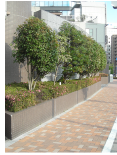
壁面後退部の緑化(1)