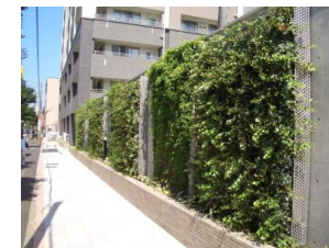
駐車場の外周緑化