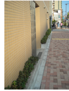
壁面後退部の緑化(2)