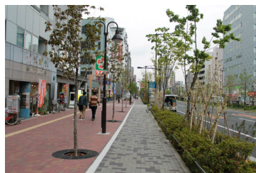
統一感のある街路樹