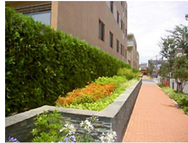
壁面後退部とフェンスの緑化(2)