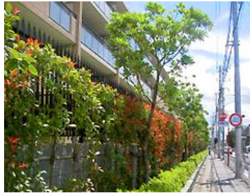
壁面後退部とフェンスの緑化(1)