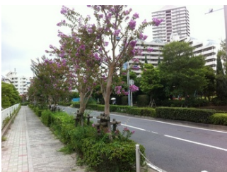
花木の街路樹の例