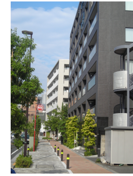
緑とうるおいあるまちなみの事例