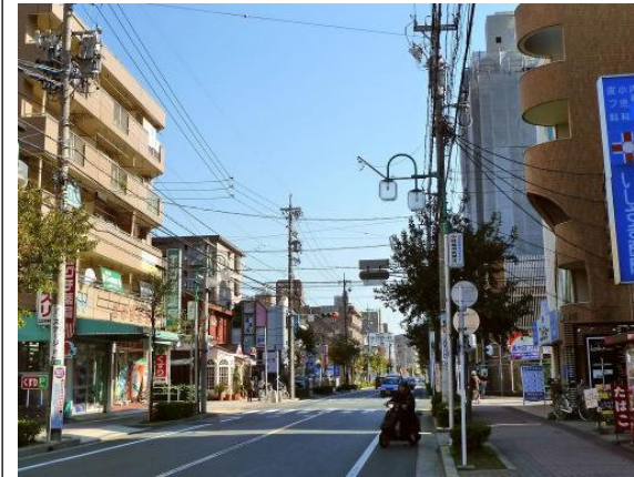
統一感の乏しいまちなみ