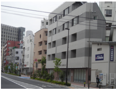
← ↑ 5~6階建てのまちなみ