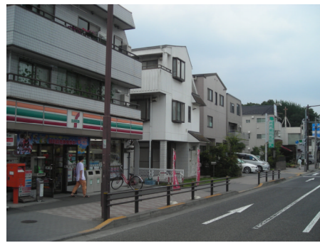
← ↑ 3階建てのまちなみ