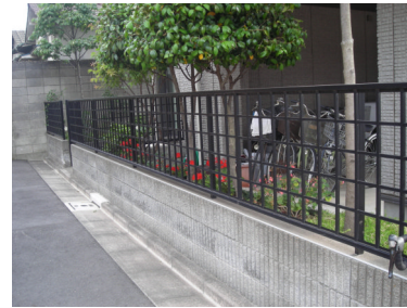
表通りだけでなく路地側にも設置