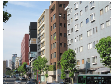
↑ ↗ 7~8階建てのまちなみ