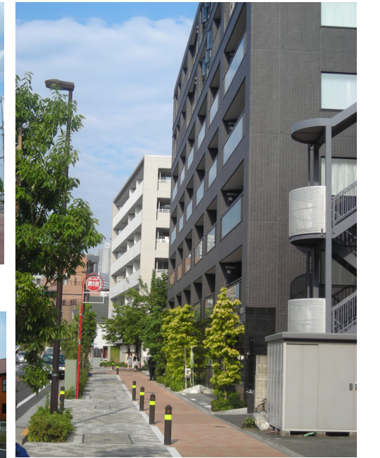
統一感のあるまちなみ