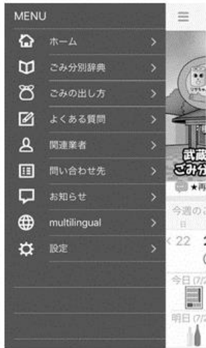
●ごみ情報誌 Vol. 22 平成31年2月発行 Let's Recycle!むさしむらやま