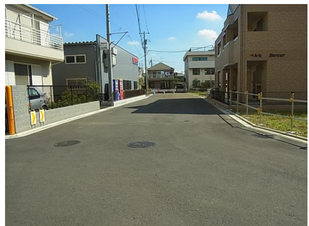
↑③区画道路築造第11号工事（幅員8m）