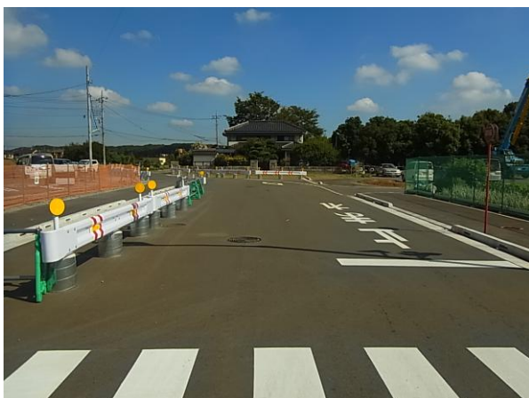
↑②都市計画道路7・4・2号榎本町線築造工事（幅員16m）