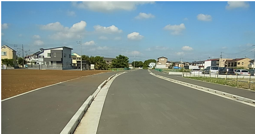
←①都市計画道路7・5・3号榎東西線築造工事（幅員14m）

昨年度施工箇所について一部ご紹介いたします（撮影箇所は3ページの工事施工箇所図を参照ください）。