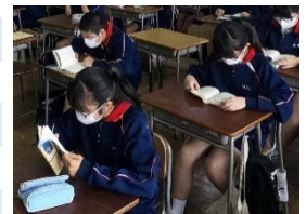
全クラスで朝読書を実施