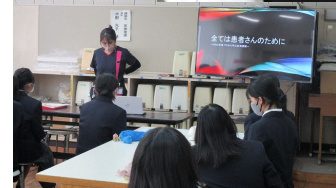
職業講話「プロから学ぶ会」