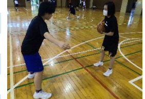
個性を伸ばす部活動