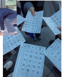
礼儀・自律・協力を旨とした「校外学習」