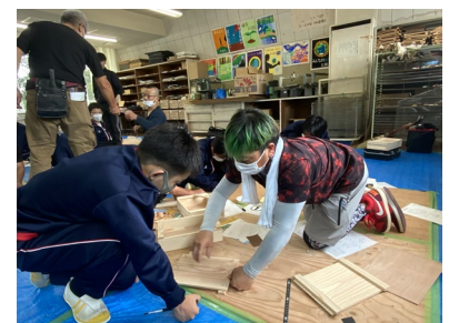
「五中フェスティバル」での体験学習

⑨コミュニティ・スクールとして地域の方々と連携し、五中フェスティバル等の学校行事を行うことにより、地域と密接に連携した学校づくりを目指します。