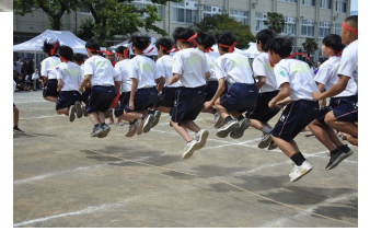
生徒の手で創り上げる「運動会」