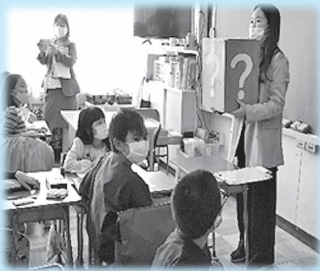
主体性を引き出す「はてなBOX」