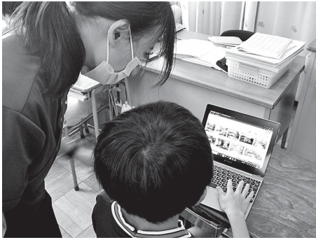
課題をタブレットで提出しています

「ICT機器の活用」 第二小学校 自分の考えを表現し、共に学ぶ児童の育成 昨年度、「自分の考えを表現し、共に学ぶ児童の育成」を研究主題として、算数科の授業を通して子供たちの学習への意欲や思考力・表現力を伸ばすために研究と実践を重ねてきました。 GIGAスクール構想において、1人1台のタブレット端末の基本的な扱い方から始め、学年に応じてスカイメニューやチームス等のアプリケーションを活用して、学習内容を共有したり、問題解決を行ったりしてきました。問題解決の手段として、タブレット端末を使用することで、子供たちの意欲が高まったり、