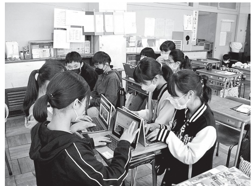
学習内容を共有し、問題解決を図っています

より深く考えを共有したりすることができました。 本年度は、昨年度得られた成果を生かし、より具体的にタブレット端末の活用場面や効果的な使い方を研究していくために、「ICT機器の活用」に重点を置いていきます。 また、子供たちが意欲的に課題に取り組むためには、問題に見通しをもち、進んで考えを表現したり、共有したりすることで、子供たち自身が課題を解決する楽しさを感じることが大切です。そのような「主体的、対話的で深い学び」を実現することを通して、子供たちの思考力・表現力をさらに伸ばしていきたいと考えています。