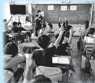
思考を深める発問とハンドサインによる意思表示