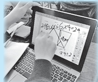
図形の書きこみや変形が可能なタブレット端末の活用