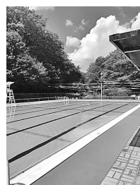
野山北公園プール