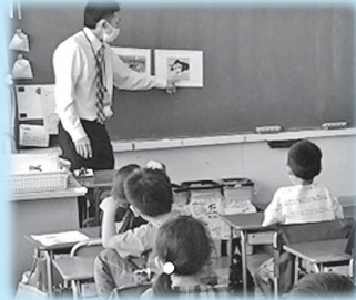
物語の要素を取り入れたアニメーション

第三小学校では、「知名度アップ大作戦」の集大成として、プロモーションビデオを制作しました。武蔵村山市を多くの人に知ってもらうため、10万回再生を目指しています。ぜひ、御覧ください!!