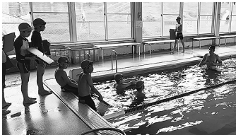
いずみスイミングスクール