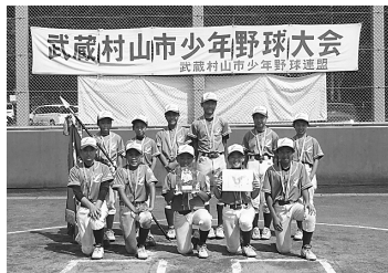
優勝一部リーグ ライオンズ Aチーム 武蔵村山市少年野球連盟