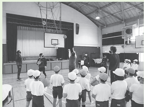
「バスケットボール教室 5年」 東京八王子ビートレインズによるバスケットボール教室を行いました。