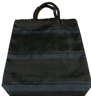
【伝統的工芸品】村山大島紬 13 手さげ (黒色)