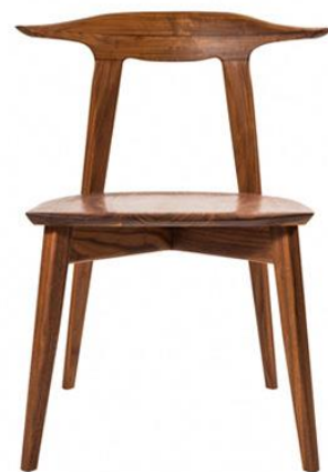
【KOMA】 23 Sim arm chair 【ウォールナット材】

The Wonder500、WOOD FURNITURE AWARD に認められた椅子です。