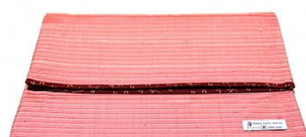
【伝統的工芸品】村山大島紬 17 Clutch Bag (赤色)

カジュアル・フォーマル両シーンで使えるように柄をデザインし、織り上げ、仕立てました。