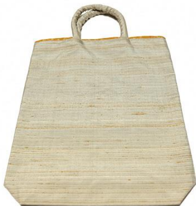
【伝統的工芸品】村山大島紬 12 手さげ (黄色)