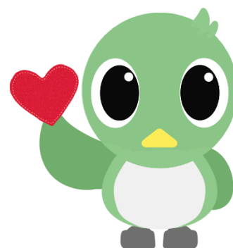
武蔵村山市広報キャラクター 「Mジロ」

1～7番は目的に対する寄附、8番は市全般に対する寄附、 9番は特定事業への寄附です。申し込みの際にお選びください。 なお、上記の記載事業は具体的な使いみちの一例です。