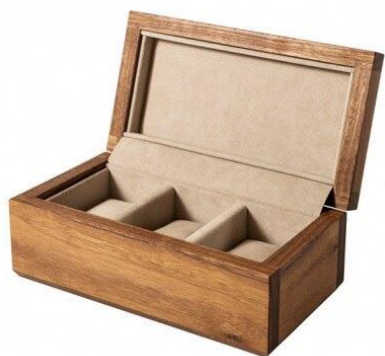
【KOMA】 39 時計ケース 3個用 ウォールナット 小根追組 クッションサイズ【M】