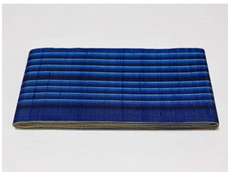
【伝統的工芸品】村山大島紬 22 両面半巾帯

手で紡いだランダムな節糸を織り込みました。とても着付けやすい帯に仕立て上がっております。