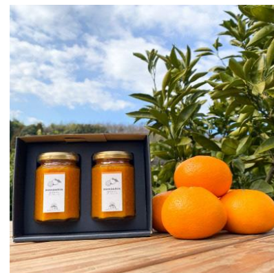
41 ※期間限定 武蔵村山市産みかん4kgと みかんマーマレード2本セット

濃厚な味の東京狭山みかんと、みかんマーマレード。狭山丘陵の恵みがたっぷり詰まったセットです。