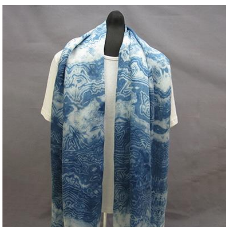
【伝統的工芸品】村山大島紬 18 板締藍染ストール