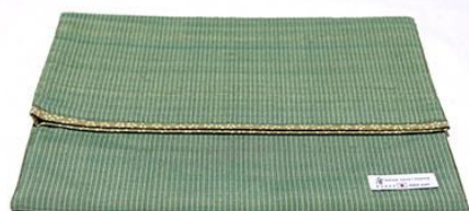
【伝統的工芸品】村山大島紬 15 Clutch Bag (緑色)

カジュアル・フォーマル両シーンで使えるように柄をデザインし、織り上げ、仕立てました。