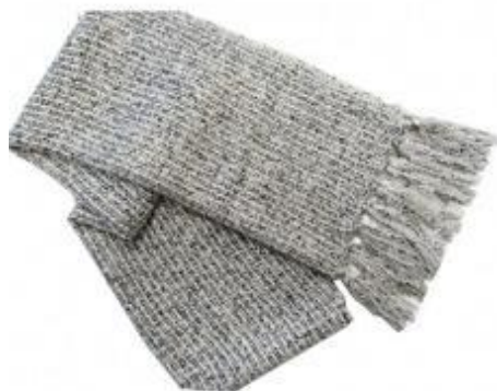
【伝統的工芸品】村山大島紬 19 板締紺手織ストール

村山大島紬の紺糸を使い織り込んだストールです。軽くてやわらかい肌触りが好評です。