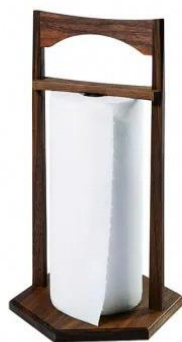
【KOMA】 40 Kitchen paper holder