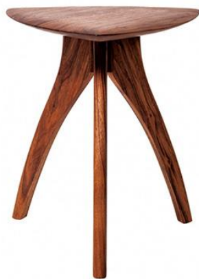
【KOMA】 21 Pick stool

玄関でのちょっとした腰掛、お部屋の飾り台など場所を選ばず使える、可愛いデザインの stool です。