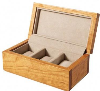
【KOMA】 36 時計ケース 3個用 チェリー 小根追組 クッションサイズ【S】