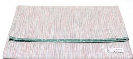
【伝統的工芸品】村山大島紬 16 Clutch Bag (白色)

カジュアル・フォーマル両シーンで使えるように柄をデザインし、織り上げ、仕立てました。