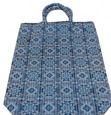
【伝統的工芸品】村山大島紬 14 手さげ (青色)