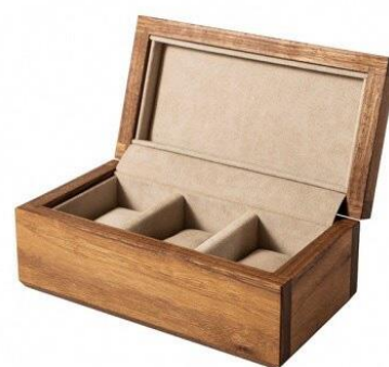
【KOMA】 38 時計ケース 3個用 ウォールナット 小根追組 クッションサイズ【S】