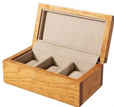
【KOMA】 37 時計ケース 3個用 チェリー 小根追組 クッションサイズ【M】