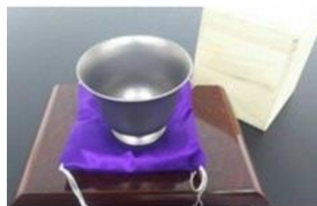
20 純チタン製ぐい呑み『鉄塊』