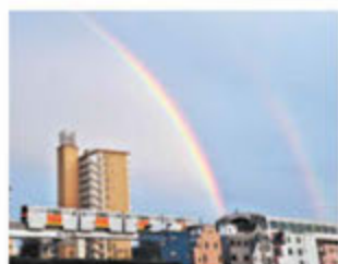
「夕虹に見送られて」