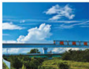
「夏を走るモノレール」